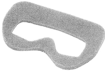
Sanibel VNG Foam Pad per goggle mask